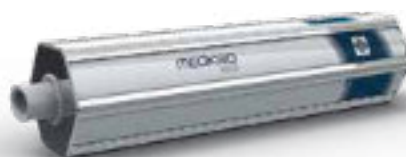
Seringue de calibration MEDIKRO®